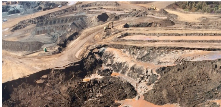
Figura 1 Vista aérea do local após o deslizamento de terra.

As vítimas do soterramento, operários da empresa, foram atingidas pelo desabamento de grande quantidade de rejeitos, que caíram sobre os veículos por elas utilizados para o trabalho – três caminhões, um Fiat Uno e duas retroescavadeiras. Cinco dos inicialmente soterrados foram socorridos com vida. Quanto aos demais, foi constatado o óbito imediato de dois dos funcionários e o corpo do último, desaparecido quando do acidente, foi encontrado mais de 80 dias depois.